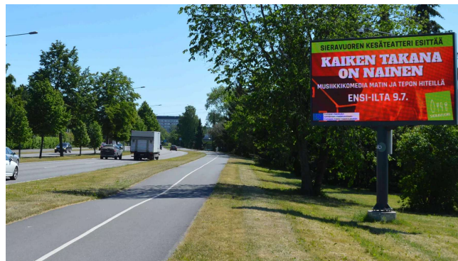
Turku - Satakunnantie