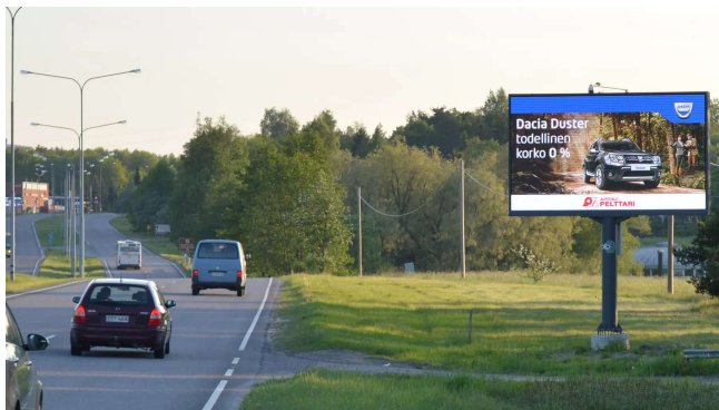
Turku - Hämeen valtatie