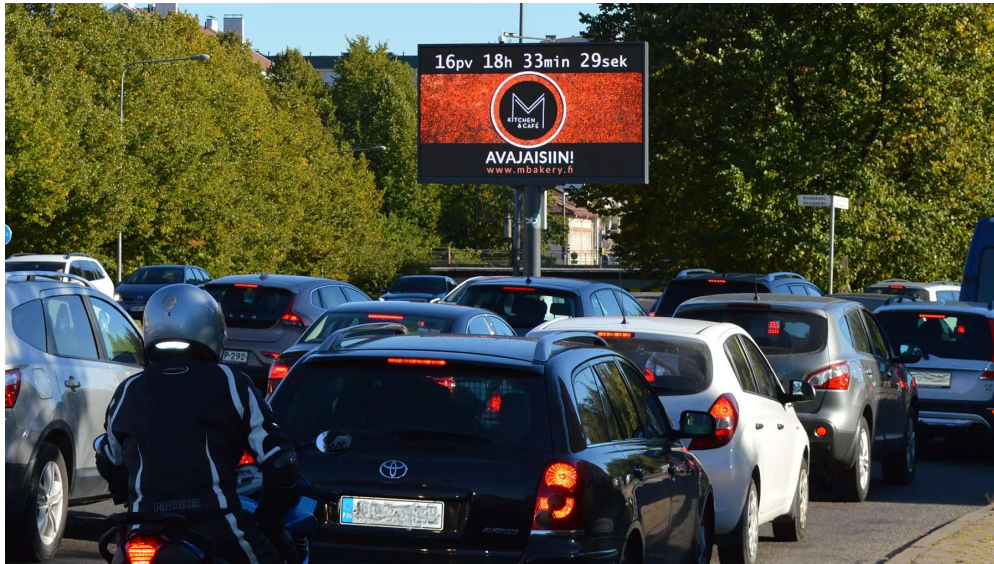
Turku - Naantalin pikatie